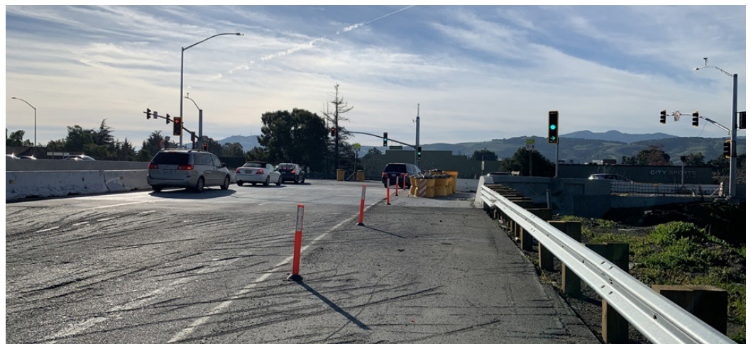
New US 101 southbound off-ramp toward Blossom Hill Road.