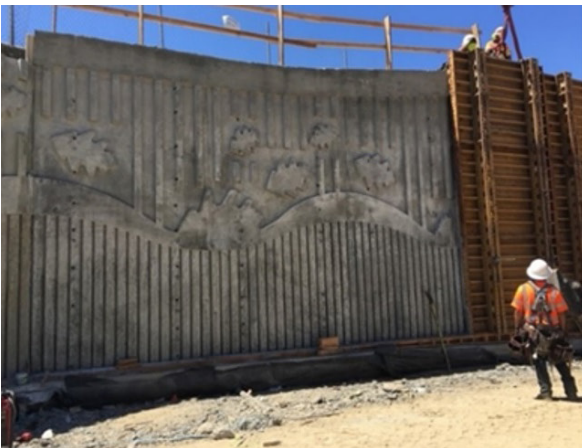
New retaining wall west of the northbound on-ramp toward US 101 off Blossom Hill Road.

Ampliación del paso a desnivel elevado de Blossom Hill Road sobre la US 101