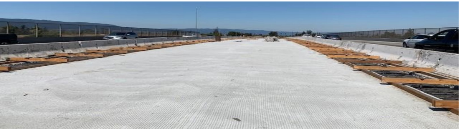
Widening Blossom Hill Road overcrossing at US 101

Ampliación del paso a desnivel elevado de Blossom Hill Road sobre la US 101