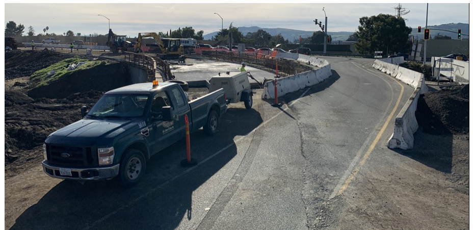
Reconfigured loop on-ramp toward southbound US 101 off Blossom Hill Road, during excavation of the new bike and pedestrian undercrossing.