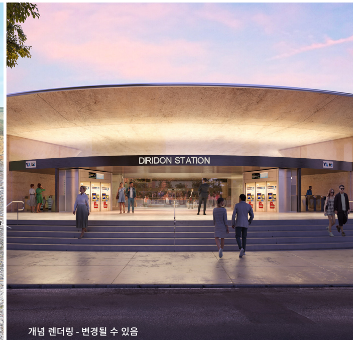
개념 렌더링 - 변경될 수 있음

디리돈 역(Diridon Station)은 몽고메리 거리(Montgomery Street)와 카힐 거리 (Cahill Street) 사이에 있으며 산타클라라 거리 (Santa Clara Street) 남쪽에 있습니다. 매표소, 개찰구 및 자전거 시설은 지상층에 있고 역 중앙 홀과 적층식 승강장은 지하에 있습니다. 승강장 동쪽과 서쪽 끝에는 비상 출구 및 환기 시설이 건설됩니다. 보행자 연결은 현 디리돈 칼트레인 역(Diridon Caltrain Station)과 VTA의 디리돈 경전철 역(Diridon Light Rail Station) 그리고 향후의 디리돈 인터모달 역(Diridon Intermodal Station) 까지 제공됩니다. 역세권은 구글 다운타운 웨스트(Google's Downtown West)를 포함한 주변 혼합개발과 통합되어 세심하게 계획된 교통지향형 커뮤니티를 형성할 것입니다.