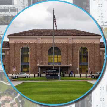
San Jose Diridon 역

(408) 321-2345 (408) 321-2300 (408) 321-2330