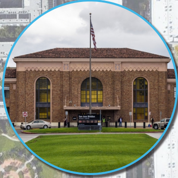
San Jose Diridon 站