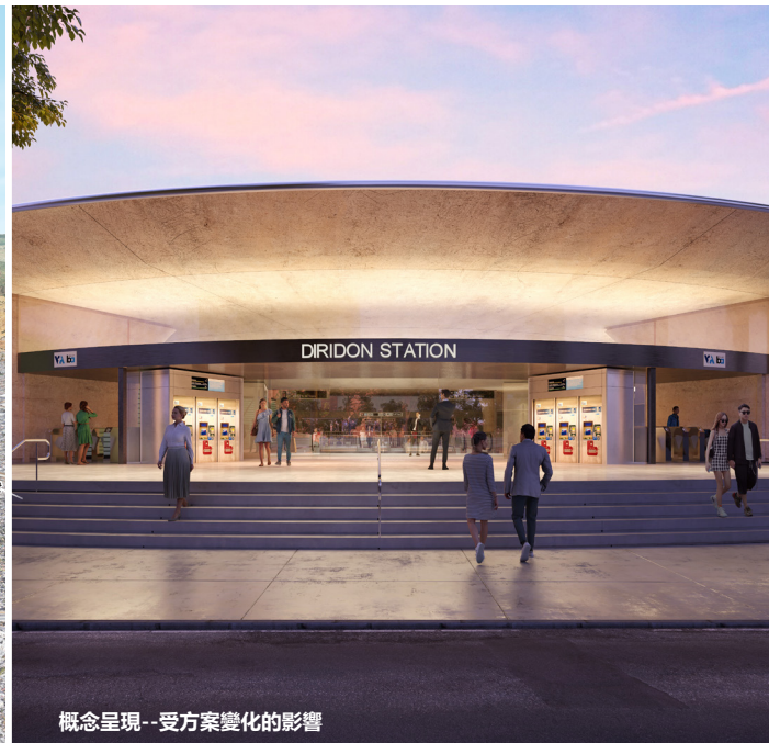
概念呈現--受方案變化的影響

Diridon站將位於Montgomery和Cahill Streets之間，在Santa Clara街的南側。售票、檢票口和自行車設施將在街道上，而車站的大廳和堆疊式月臺將在地下。在月臺的東西兩端，將建設應急出口和通風設施。行人接駁可至目前的Diridon Caltrain站和VTA的Diridon輕便鐵路站，以及未來的Diridon聯運站。車站區域將與周圍的混合用途開發整合，包括穀歌的西部市中心，創造一個全方位、規劃完全的交通導向社區。